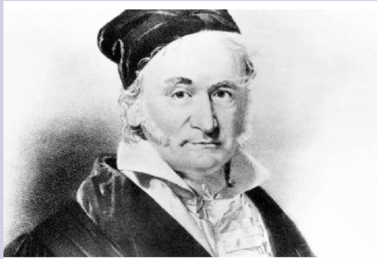
Carl Friedrich Gauss "Príncipe de los matemáticos"

Acostumbra a contarse una anécdota infantil de Carl Friedrich Gauss (Alemania, 1777 - Alemania, 1855) que retrata su precoz personalidad. Tenía entonces 10 años cuando su maestro, seguramente buscando descanso y el silencio de la clase durante unos minutos, le impuso a él y a sus compañeros una tarea que seguramente les llevaría tiempo: sumar todos los números del 1 al 100: