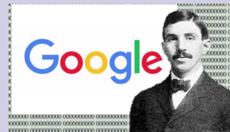
Edward Kasner & Google

Durante muchos años, el ingenuo invento de Sirotta se paseó por los textos de matemáticas como una invención ocuriente hasta que llegó Google . La hoy gigantesca empresa informática la fundaron en 1998 dos jóvenes matemáticos norteamericanos, Larry Page (Estados Unidos, 1973) y Sergey Brin (Rusia, 1973), y empezó ofreciendo un simple "motor de búsqueda", su gran aportación al mundo de Internet y a la que han seguido otras muchas herramientas. El nombre de la compañía no es más que una variante de la palabra " googol ", un término que, como hemos visto, ya había sido usado copiosamente. En el momento de crear Google no se llevaban indexadas más que 24 millones de páginas de Internet, cifra que está bastante lejos del googol de páginas, pero es sabido que los matemáticos son seres optimistas.